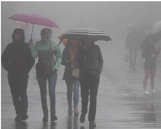
Borrasca en Canarias

El Cabildo de Tenerife ha activado de forma preventiva el Plan de Emergencias Insular de Tenerife (PEIN) en situación de Alerta, ante la previsión de un episodio de fenómenos meteorológicos adversos asociado a la llegada de la borrasca Cathaysa, según la información facilitada por la Agencia Estatal de Meteorología (AEMET) y la Dirección General de Emergencias del Gobierno de Canarias.