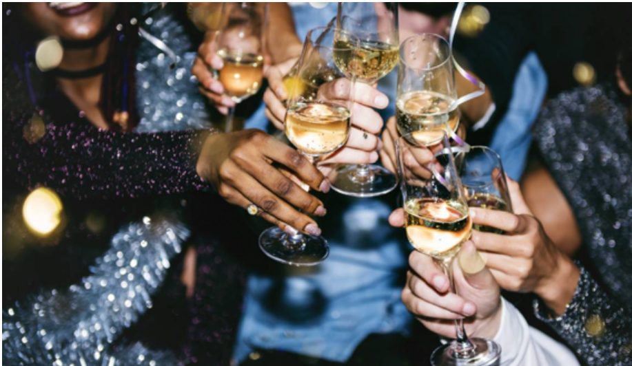
Fiesta de fin de año

La llegada de 2026 confirma un cambio en la forma de celebrar la Nochevieja. Este 31 de diciembre, cada ciudadano gastará de media 285 euros entre vestimenta, cena y celebraciones, según datos del sector. Crecen con fuerza las cenas privadas y reuniones en domicilios, mientras pierden peso los grandes eventos y fiestas masivas.